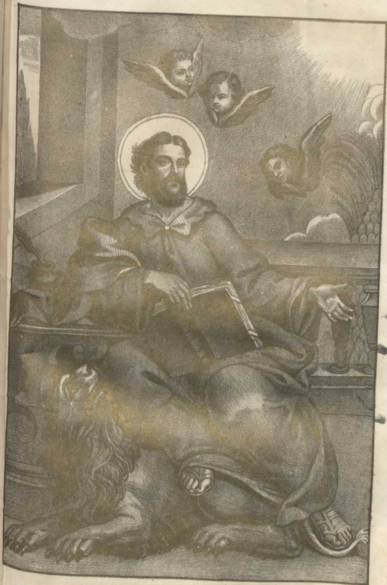
Ο ΑΓΙΟΣ ΑΠΟΣΤΟΛΟΣ ΚΑΙ ΕΥΑΓΓΕΛΙΣΤΗΣ ΜΑΡΚΟΣ.